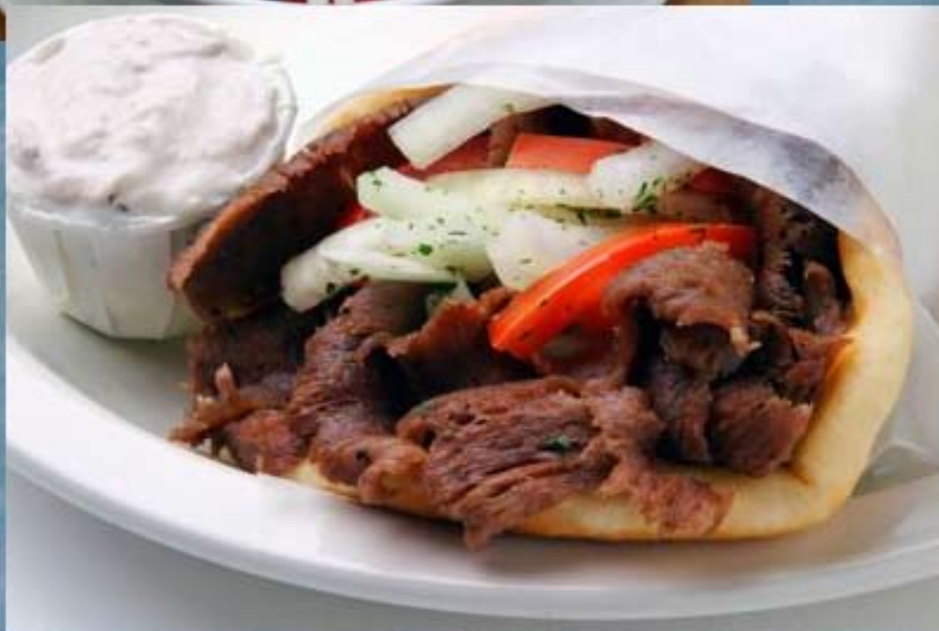
Famoso plato de comida rápida: Gyros

Si con la ensalada y el tzatziki te has quedado con algo de hambre puedes elegir entre un gran número de tentempiés asequibles y muy ricos: Spanakopita, espinacas envueltas en pasta, Tyropita queso feta envuelto en pasta o un gyros, plato muy conocido que consiste en carne asada verticalmente en un horno, se sirve con salsa (a menudo tzatziki) y acompañado decorativamente con tomate y cebolla sobre un pan de pita. El gyros es un plato muy popular de comida rápida.